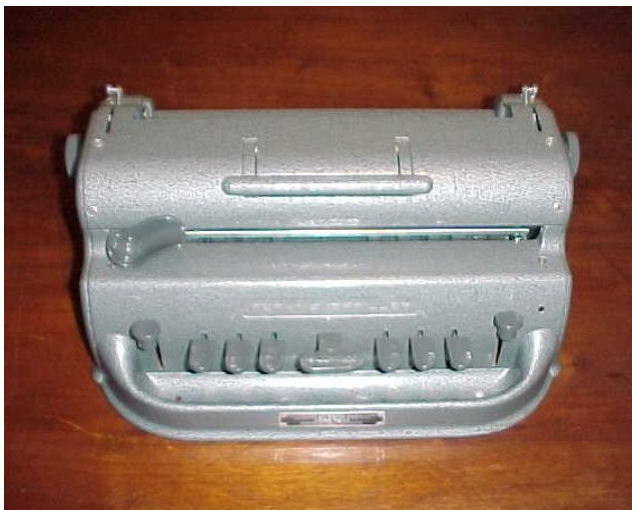
Figura 2 – Máquina de datilografar Perkins